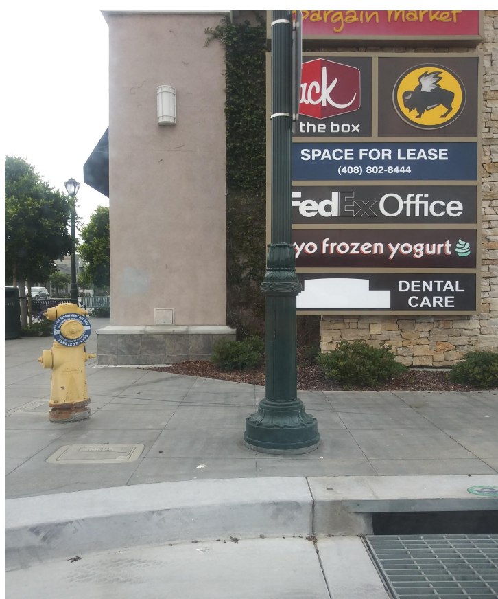
小さいショッピングセンター