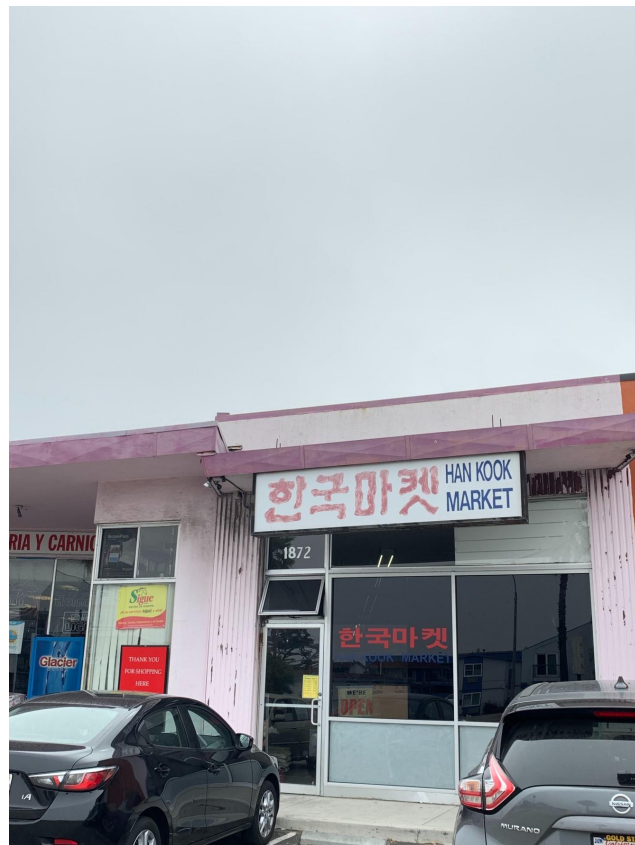
二つのマーケット