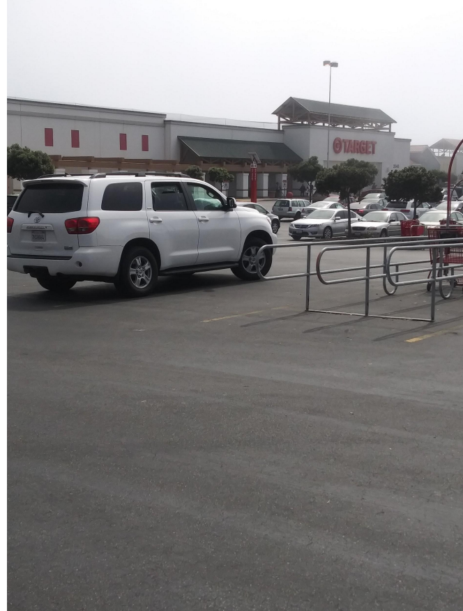
大きいショッピングセンター